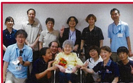
誕生日会でお祝い